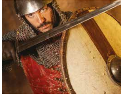
Spectacle « Aliénor » © Compagnie Estocade