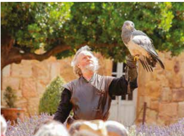
Spectacle de fauconnerie