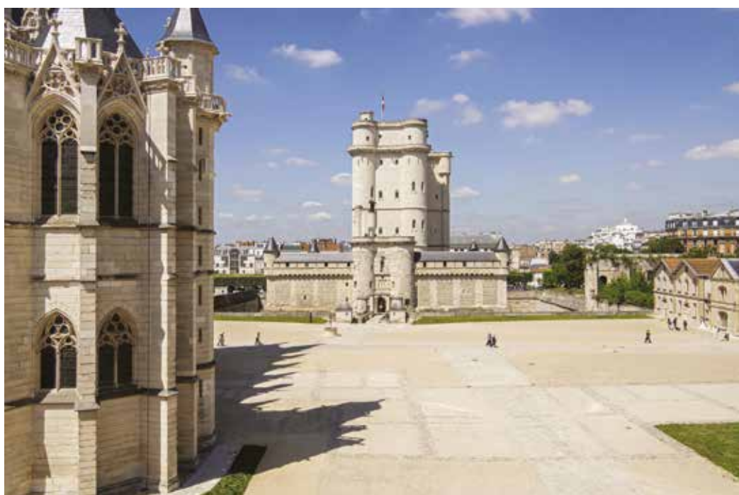
Donjon du château de Vincennes vu depuis la tour des Salves

En se connectant sur www.mapierraeledifice.fr , les amoureux du patrimoine peuvent faire un don pour le château de Vincennes (« Mon monument préféré ») et ainsi contribuer à l'animer, l'entretenir et le préserver.