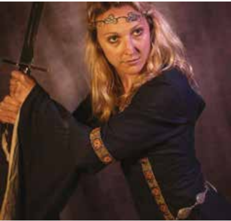
Spectacle « Aliénor » © Compagnie Estocade