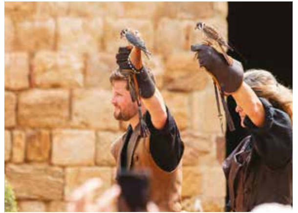
Spectacle de fauconnerie