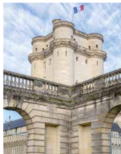
Donjon du château de Vincennes

La Sainte-Chapelle, dont la construction débuta vers 1390, fut inaugurée en 1552. Elle était destinée à abriter une partie des reliques du Christ. Témoignant de la transition entre le gothique rayonnant et le gothique flamboyant, elle se compose d'un vaisseau unique, d'un chœur et d'une abside. Ses vitraux ont été conçus par Nicolas Beaurain.