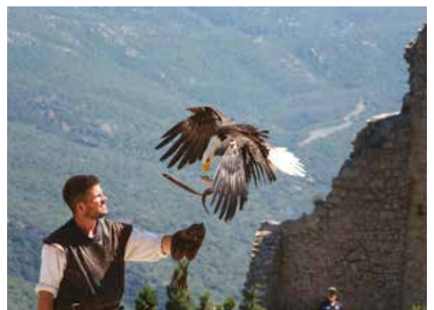
Spectacle de fauconnerie