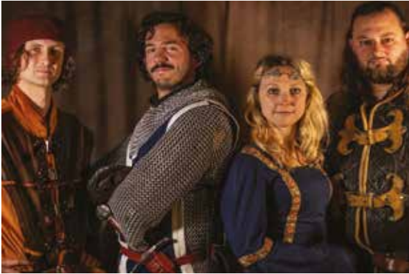
Spectacle « Aliénor » © Compagnie Estocade