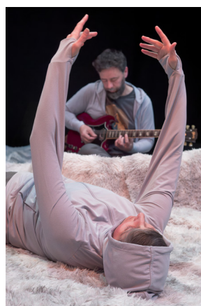
Spectacle « Ecoute, je danse ! »