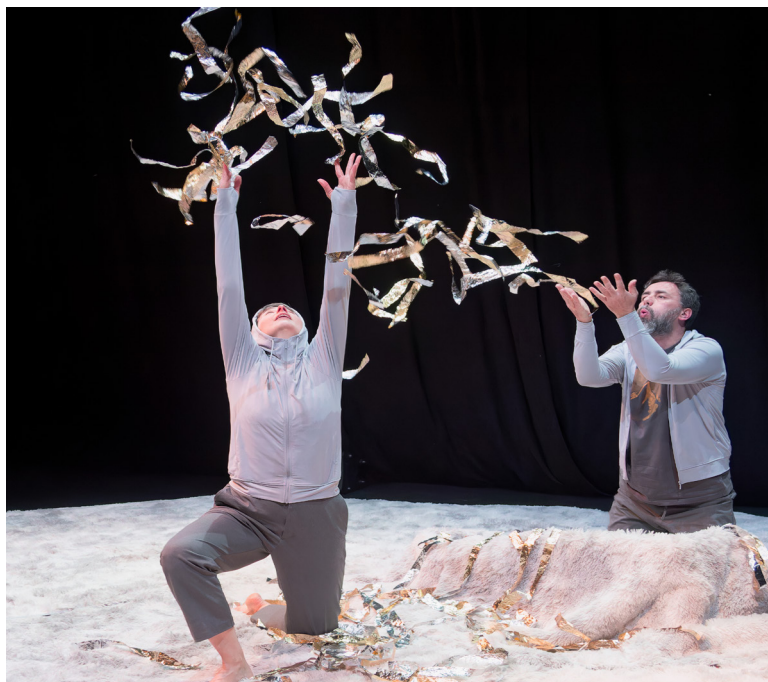
Spectacle « Ecoute, je danse ! »

Tarifs : Adultes 14 € Enfants et publics spécifiques 8 € Gratuit pour les tout-petits jusqu'à 3 ans inclus