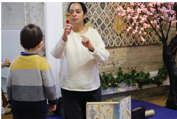
« Les contes des tout-petits »