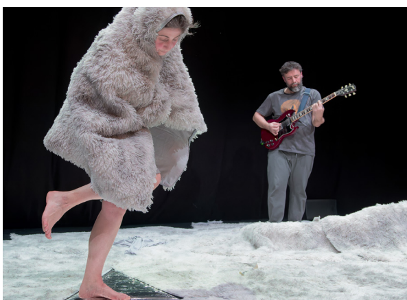
Spectacle « Ecoute, je danse ! » © Marc Doumèche