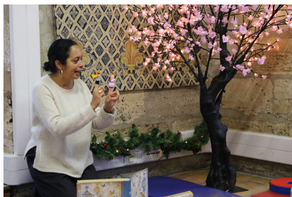
« Les contes des tout-petits » © Alison DE ALMEIDA CMN