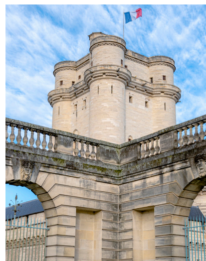
Donjon du château de Vincennes

La Sainte-Chapelle, dont la construction débuta vers 1390, fut inaugurée en 1552. Elle était destinée à abriter une partie des reliques du Christ. Témoignant de la transition entre le gothique rayonnant et le gothique flamboyant, elle se compose d'un vaisseau unique, d'un chœur et d'une abside. Ses vitraux ont été conçus par Nicolas Beaurain.