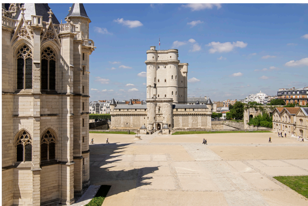
Donjon du château de Vincennes vu depuis la tour des Salves

En se connectant sur www.mapierrealedifice.fr , les amoureux du patrimoine peuvent faire un don pour le château de Vincennes (« Mon monument préféré ») et ainsi contribuer à l'animer, l'entretenir et le préserver.