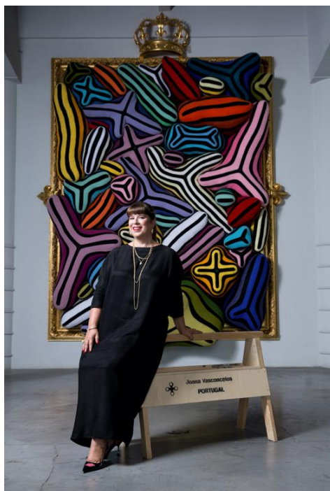
Portrait Joana Vasconcelos

Née à Paris en 1971, Joana Vasconcelos est une plasticienne réputée pour ses sculptures monumentales, avec une pratique de presque 30 ans qui s'intéresse également au film et au dessin. Elle a cherché à interroger ce que peut être l'artisanat au XXI e siècle. Elle intègre les objets du quotidien avec ironie et humour, créant un lien entre environnement domestique et espace public, tout en questionnant le statut de la femme, la société de consommation et l'identité collective.