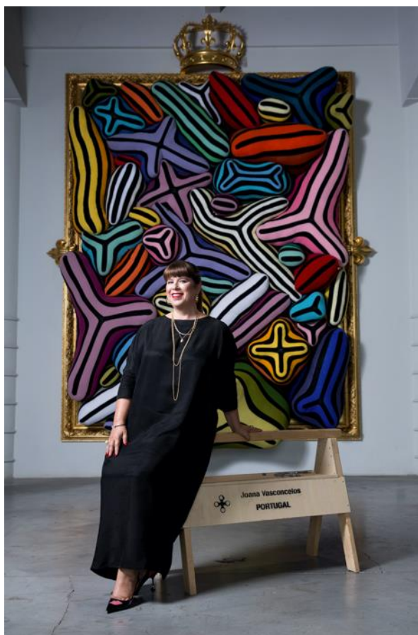
Portrait Joana Vasconcelos